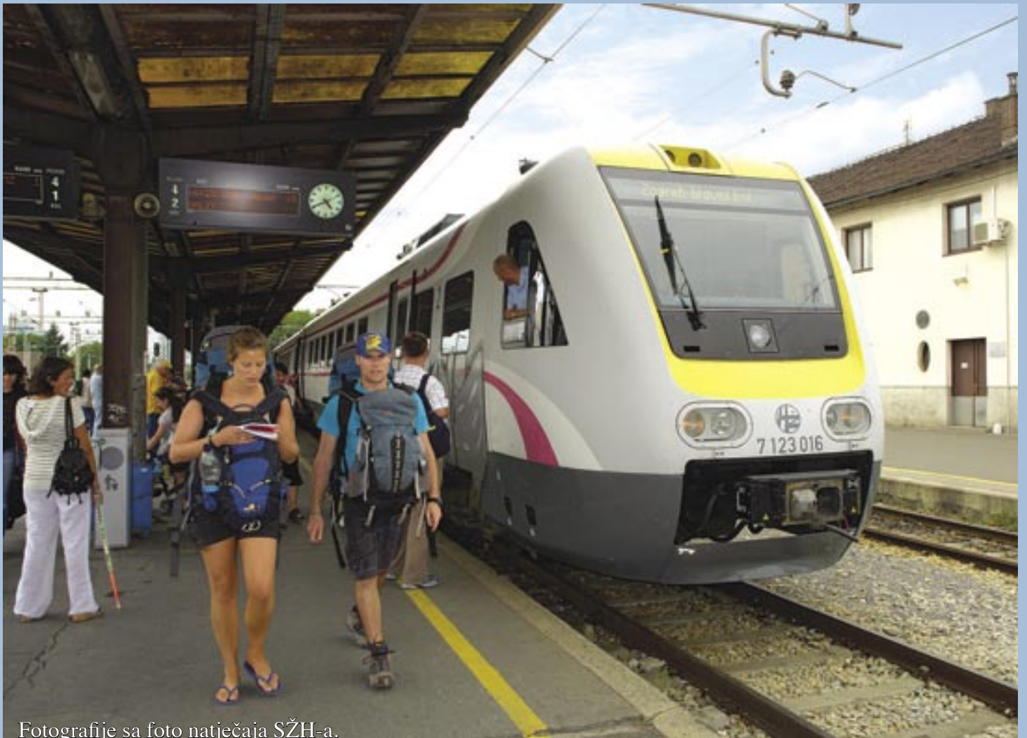
Fotografije sa foto natječaja SŽH-a.